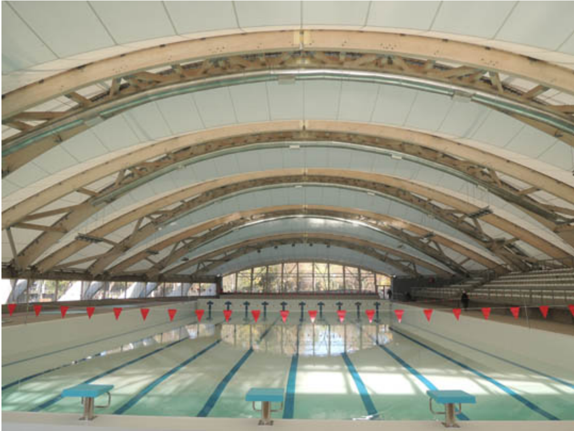
Piscina Olímpica de Santiago Parque O'Higgins